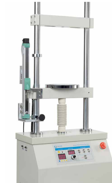
Motorisierter Prüfstand inkl. Längenmesssystem LD